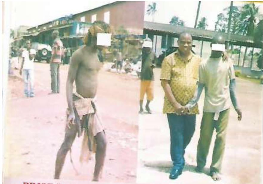
Avant et après