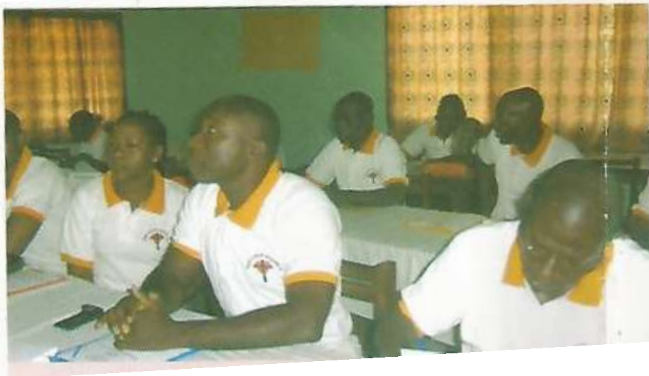
Atelier de formation 2020 en vue de sensibilisation