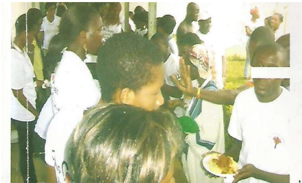
Partage de repas avec les malades